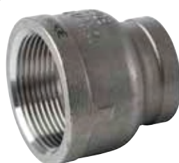
Threaded reducing socket - F/F (type 335)

Redukce závitová - vnitřní / vnější (F/M) vnitřní závit válcový G / vnější R kuželový materiál: AISI 316