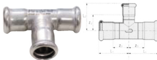
INOX PRESS T-piece reducing F/F/F