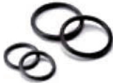
INOX PRESS - OR seal ring