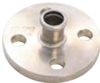
INOX PRESS - Adaptor flange PN 16 / F (press)