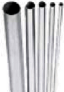
INOX PRESS - Tubes